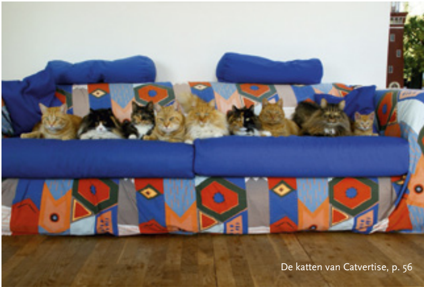
De katten van Catvertise, p. 56